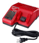
CARGADOR MULTI VOLTAJE