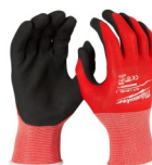
GUANTES ANTI CORTE