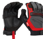
GUANTES DE TRABAJO