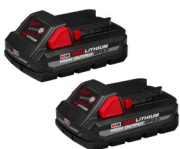
SET DE BATERÍAS 18V