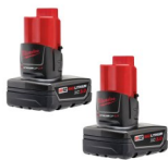
SET DE BATERÍAS 12V 3.0 AH