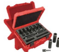
SET DE CUBOS DE IMPACTO