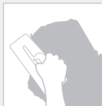
2. Aplicar Decopasta