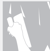
3. Aplicar segunda capa de Decopasta