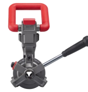
CONJUNTO CABLE DRIVE