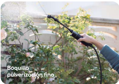
Boquilla pulverización fina