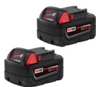
SET DE BATERÍAS 18V